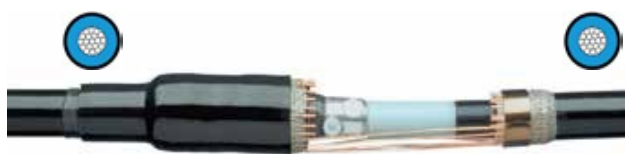
Муфта POLJ зі стандартним діапазоном застосування

Муфти цього типу дають змогу з'єднувати кабелі з великою різницею за перетином жил. Наприклад, під час з'єднання кабелів із діапазону перетинів 25 - 240 мм 2 із кабелями в діапазоні перетинів 185 - 630 мм 2 . Такі муфти відрізняються тим, що в конструкції використовується спеціальний перехідний з'єднувач і термоусаджувальні матеріали, розраховані на відповідні діаметри жили, ізоляції та зовнішнього покриву.