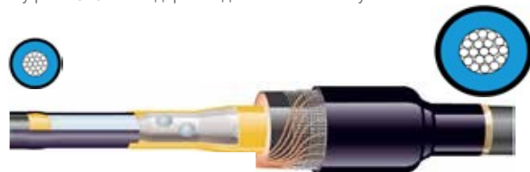
Муфта POLJ зі збільшеним діапазоном застосування