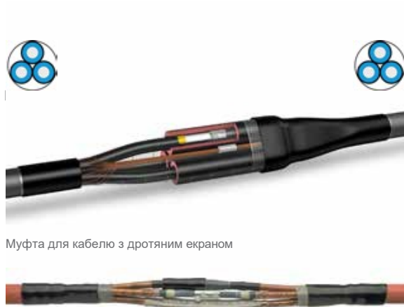
Муфта для кабелю з дротяним екраном

Комплект дає можливість використання з'єднувальної муфти для кабелів з алюмінієвим екраном.